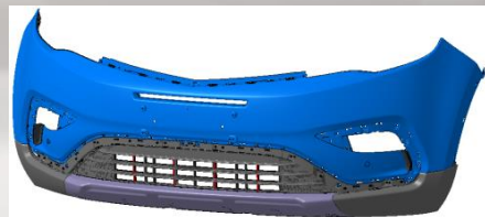
前保 Front Bumper

上本体：注塑+喷涂 Upper part: injection + painting 下本体：皮纹注塑 Lower part: Dermatoglyph injection 下饰板：注塑+喷涂 Lower decorating plate: injection + painting