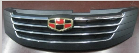
EC-7 Grille Injection + chroming + gold-plating + Assembly 注塑、电镀、镀金、装配