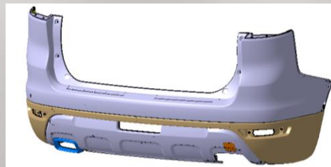
后保 Rear Bumper

上本体：注塑+喷涂 Upper part: injection + painting 下本体：皮纹注塑 Lower part: dermatoglyph injection 下饰板：注塑+喷涂 Lower decorating plate: injection + painting