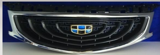
KC-1 Grille Injection + chroming + painting + Assembly 注塑、电镀、涂装、装配